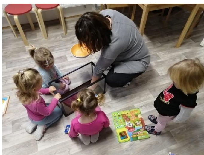
Mikrojesle Vochomůrky v Plzeňském kraji fungovaly během nouzového stavu v plném provozu (obrázek níže).