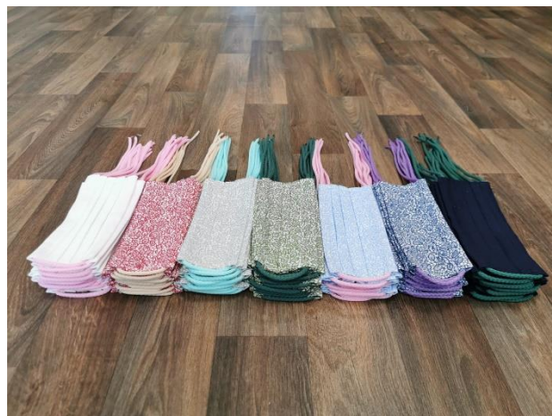
V mikrojeslích v Kroměříži se během nouzového stavu šily roušky (obrázky výše).